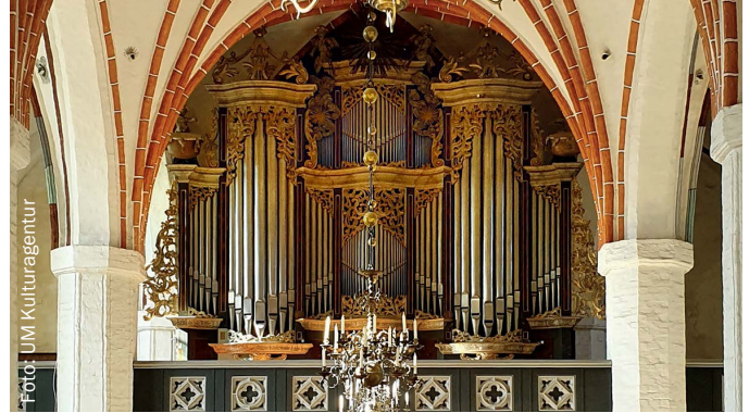
Wagner Orgel, St. Marien Angermünde